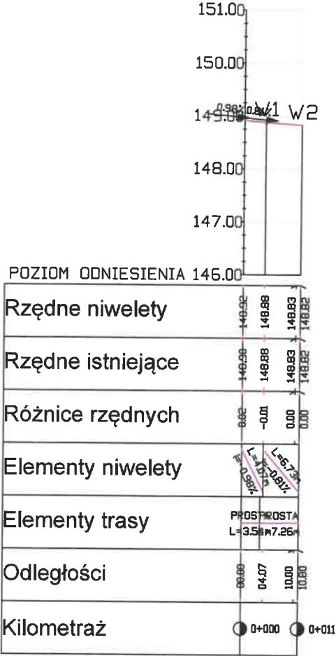
Porofil podłużny - zjazd