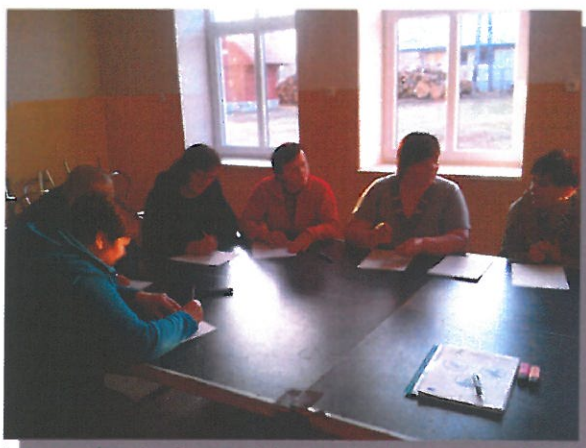
Zdjęcie: spotkanie Grupy Odnowy wsi, praca nad POM-em.

Plan Odnowy Miejscowości będzie podlegał stałemu monitorowaniu. Proces ten będzie miał na celu analizowanie stanu zaawansowania przyjętych działań oraz zgodności ich z postawionymi założeniami. Plan będzie modyfikowany przez korekty i uaktualnianie jego zapisów. Stan realizacji zaplanowanych działań i ich weryfikacja będzie procesem ciągłym, trwającym od momentu rozpoczęcia planowanych inwestycji, poprzez realizację, aż do momentu zakończenia.