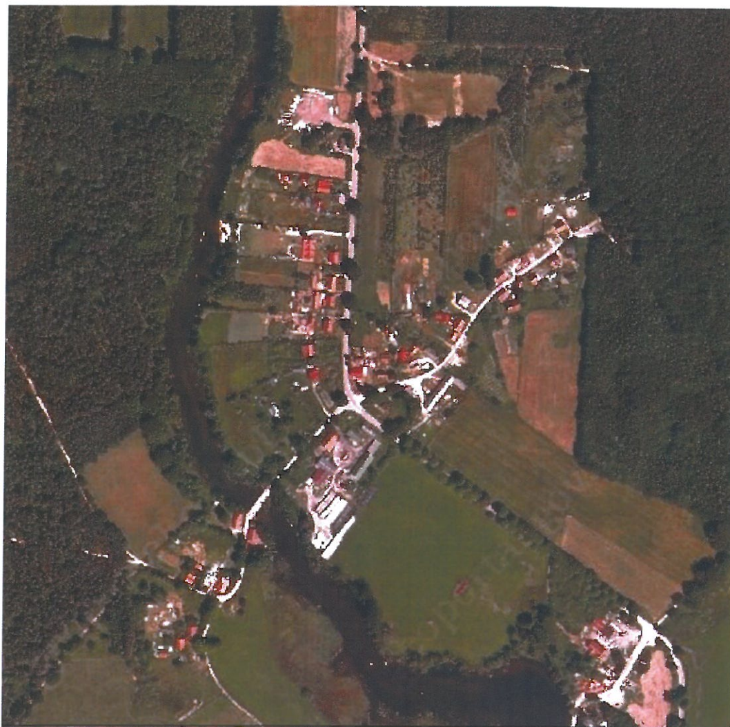
Krutyński Piecек - http://geoserwis.gdos.gov.pl/mapy/