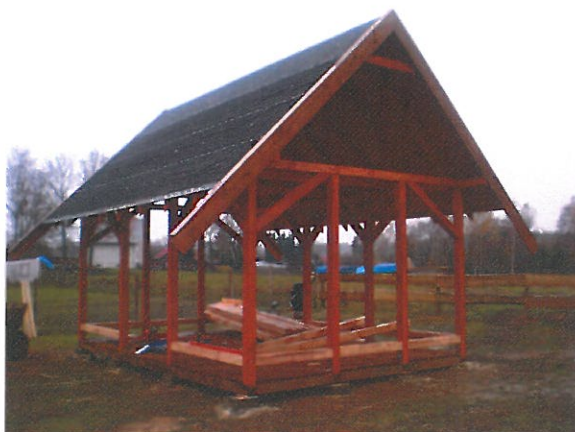
Zdjęcie: przedstawia budowaną przez mieszkańców wiatę w ramach środków funduszu sołeckiego (działka nr 37/3).