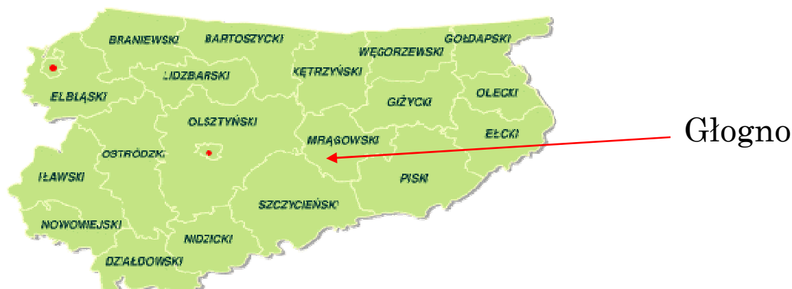
Rys.1 Umiejscowienie sołectwa Głogno na mapie województwa warmińsko-mazurskiego