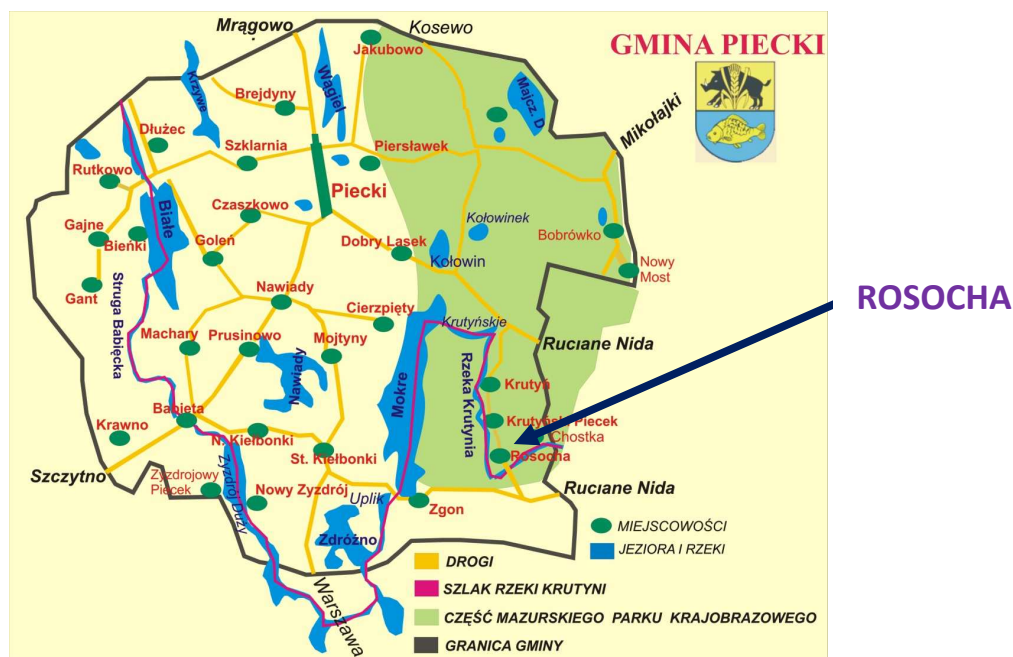
Rys. Mapa Gminy Piecki