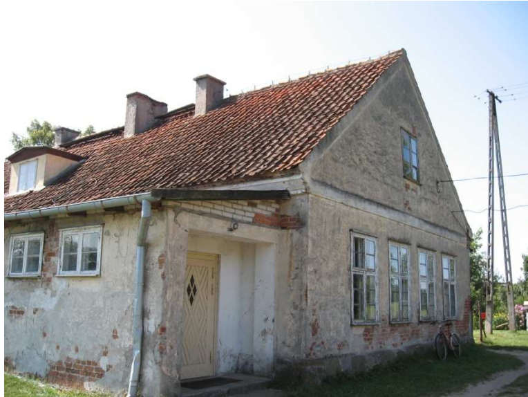
Świetlica wiejska w m. Rosocha