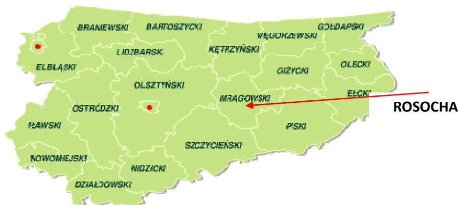
Rys.1 Umiejscowienie na mapie województwa

Rosocha to wieś położona w województwie warmińsko-mazurskim, w powiecie mrągowskim, w gminie Piecki. Miejscowość znajduje się w odległości około 20 km od Piecek i 33 km od Mrągowa, natomiast od stolicy województwa warmińsko-mazurskiego – Olsztyna o 78 km. Obręb Rosocha ma powierzchnię 1.388,22 ha co stanowi około 4,4 % powierzchni gminy Piecki, której wielkość to ok. 31.460 ha. Miejscowość zamieszkuje 70 osób (stan na luty 2010 r.). Gminę Piecki zamieszkuje 8066 osób, a gęstość zaludnienia to 25,6 os/km 2 . W skład sołectwa wchodzić prócz samej Rosochy trzy mniejsze miejscowości: Chostka, Zakręt i Rostek. Miejscowość położona jest na malowniczym szlaku rzeki Krutyni. Niedaleko Rosochy biegnie droga krajowa nr 58, która umożliwia połączenie z większymi miejscowościami.