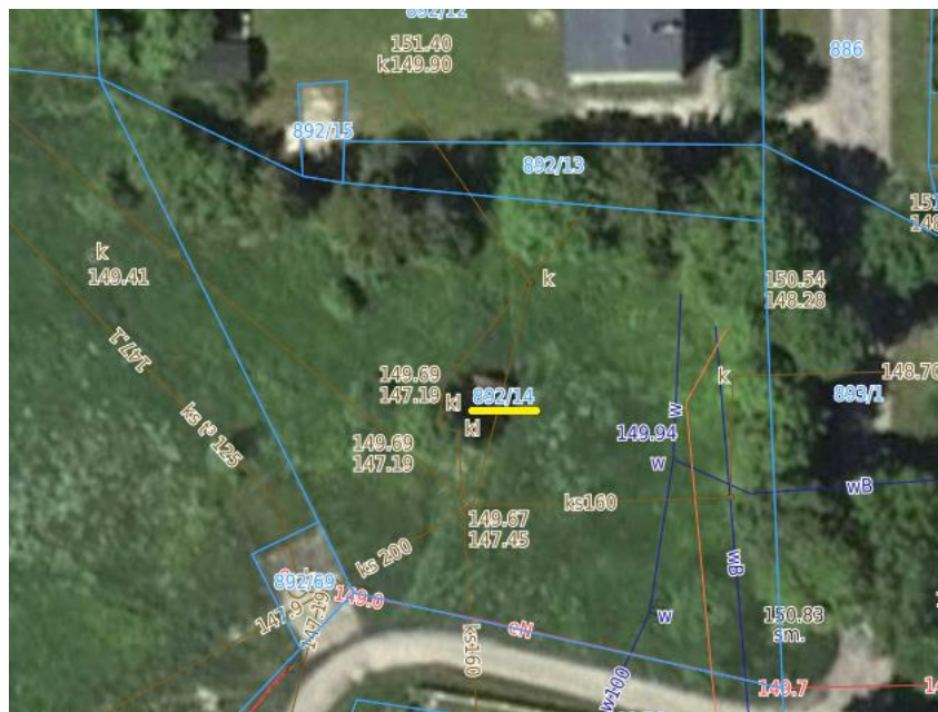
Mapa poglądowa – działka nr 892/14, Ob. Piecki

Koszt szacunkowy inwestycji – 100 000 zł