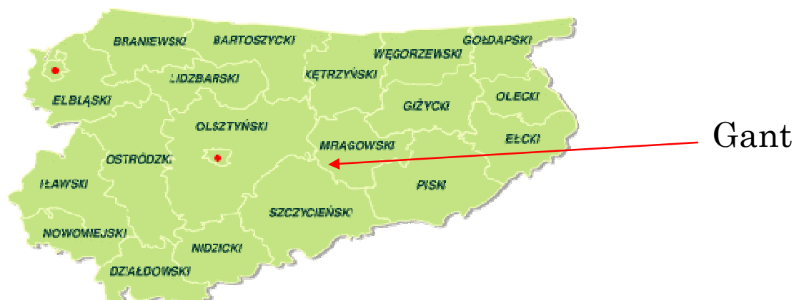
Rys.1 Umiejscowienie Gant na mapie województwa