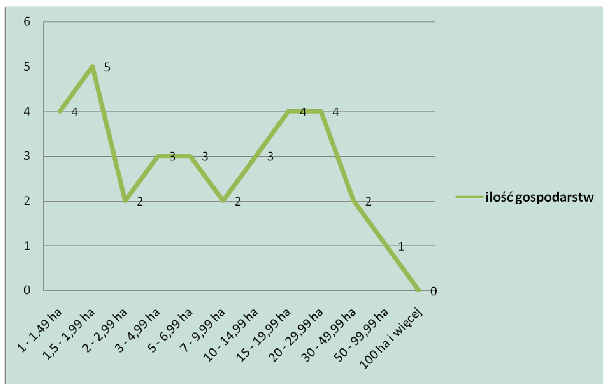
Rys. 1 Liczba gospodarstw według powierzchni

Na terenie miejscowości znajduje się 33 indywidualnych gospodarstw rolnych. Największą powierzchnie spośród gruntów zajmują grunty orne – ok. 256 ha, natomiast łąki i pastwiska stanowią ok. 179 ha powierzchni. Największą część powierzchni gruntów ornych stanowią grunty klasy III – 43 %, klasy IV – 35 %, klasy V – 11%, klasy VI – 9 %. W przypadku pastwisk i łąk większość – 67 % całej powierzchni stanowią grunty klasy IV, pozostałe III, V i najmniejsza ich część klasy IV.