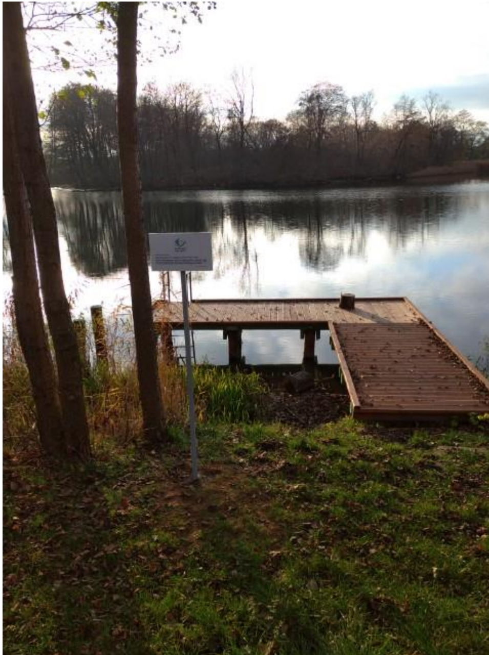
Fot. Pomost w Sołectwie Szklarnia, Jezioro Krzywy Róg (przykład połączenia środków funduszu sołeckiego i dofinansowania ze środków Samorządu Woj. Warm.Maz.)

np. technicznych możliwości realizacji danego zadania. Realizacja poszczególnych zadań nie byłaby możliwa bez zaangażowania Sołtysów, wspieranych przez mieszkańców sołectw. Znajomość potrzeb danego sołectwa ma bezpośredni wpływ na efektywność realizowanych zadań. W ramach funduszu sołeckiego realizowane były zadania polegające m.in. na remontach dróg, wykaszaniu publicznych terenów zieleni, organizacji konkursów i warsztatów, wymianie oświetlenia na energooszczędne, zagospodarowaniu przestrzeni publicznych.