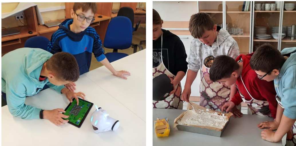
Fot. zajęcia realizowane w laboratoriach przyszłości (SP Piecki).

W ramach Laboratoriów Przyszłości szkoły otrzymały wsparcie finansowe na zakup wyposażenia technicznego potrzebnego w kształtowaniu i rozwijaniu umiejętności manualnych i technicznych, umiejętności samodzielnego i krytycznego myślenia, zdolności myślenia matematycznego oraz umiejętności w zakresie nauk przyrodniczych, technologii i inżynierii, stosowania technologii informacyjno-komunikacyjnych, jak również pracy zespołowej, dobrej organizacji i dbania o porządek na stanowisku pracy oraz radzenia sobie w życiu codziennym. Laboratoria Przyszłości stanowią nowoczesny sprzęt, który uatrakcyjni zajęcia szkolne i pozwoli uczniom rozwijać swoje zainteresowania nie tylko techniki i w ramach innych obowiązkowych zajęć edukacyjnych, lecz także w ramach zajęć pozalekcyjnych, kół zainteresowań i innych form rozwijania umiejętności.