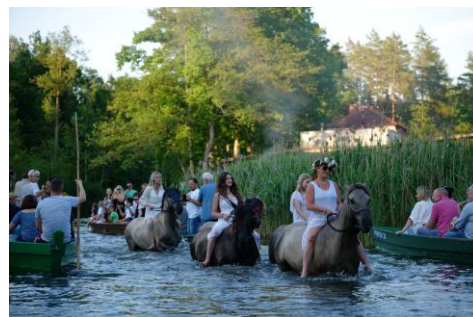
Noc Świętojańska w Krutyń