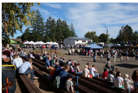
Dożynki gminne 2022

Zajęciami i opieką zostało objętych 31 osób (dzieci od 2 roku życia, przedszkolaki, uczniowie szkół podstawowych i ponadpodstawowych, dorośli i rodzice dzieci). W ciągu roku na świetlicy odbywały się zajęcia plastyczno-techniczne, sportowe, artystyczne, stolikowe, wychowawcze i dydaktyczne. Były organizowane wycieczki, ogniska oraz imprezy okolicznościowe.